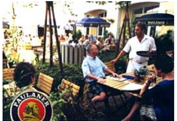
PAULANER IM TAL