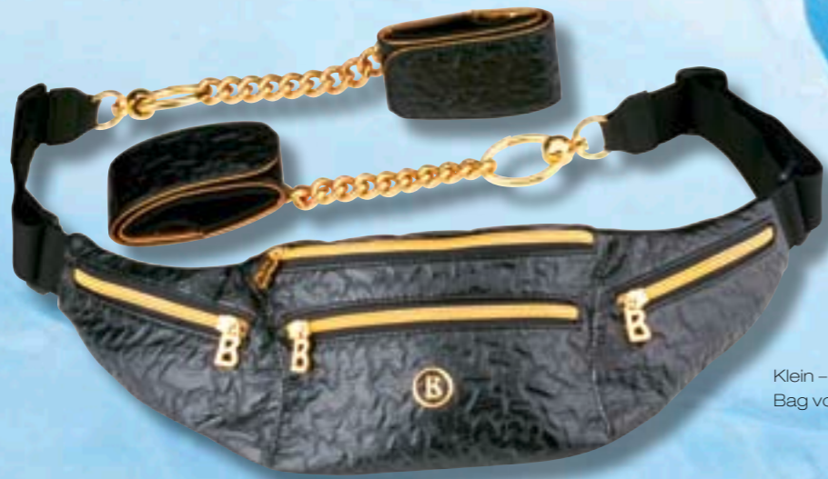
Klein – passt Vieles rein. Bag von Bogner